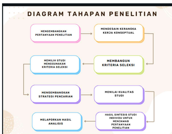
Gambar 1. Diagram Tahapan Penelitian

Prosedur systematic literature review secara lebih rinci yang diawali dengan mengembangkan pertanyaan penelitian. Kemudian mendesain kerangka kerja konseptual, membangun kriteria seleksi, mengembangkan strategi pencarian, memilih studi menggunakan kriteria seleksi, studi pengkodean, menilai kualitas studi, hasil sintesis studi individu untuk menjawab pertanyaan penelitian, dan tahap akhir adalah melaporkan penemuan atau hasil analisis. Berikut ini disajikan alur tahapan berupa diagram yang tersaji pada Gambar 1.